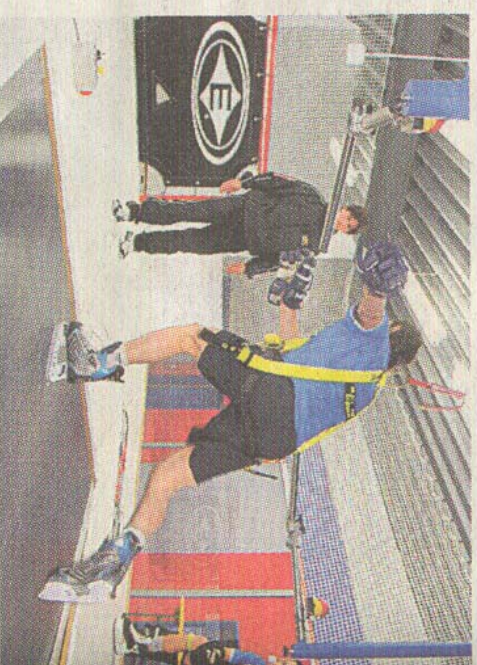
Wenn sich Zugs Christen einmal sicherer fühlt, kann er während dem Laufen auch noch auf das Tor schiessen.